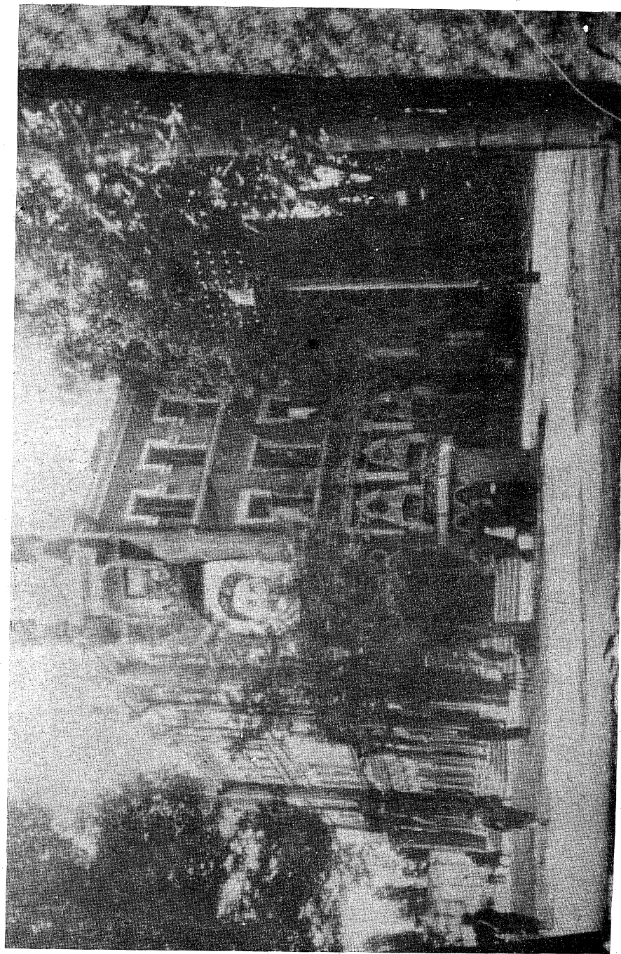
4 - رەسىم: ساكۇ ئۇنىۋېرسىتېتىدىن بىر كۆرۈنىش.